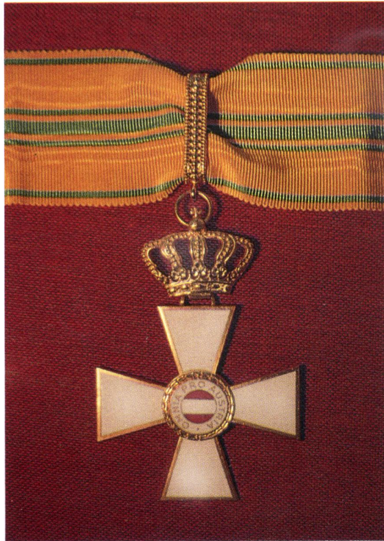
8. GROSSES KOMTURKREUZ MIT KRONE